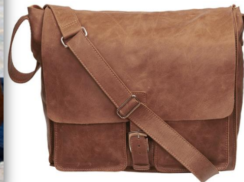
Xhosa large cocoa