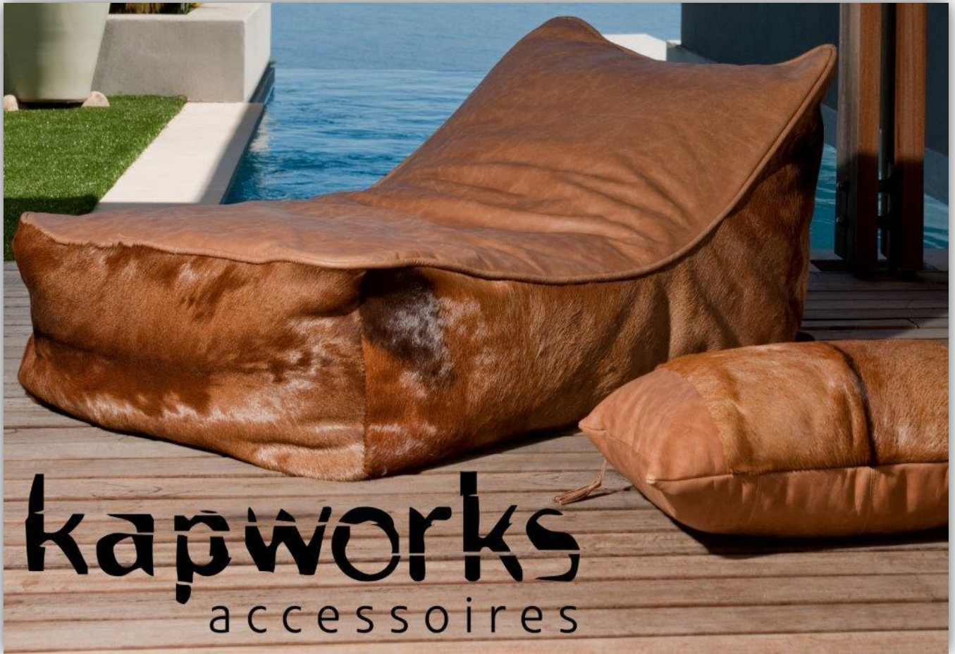
Abb. Recliner Hartebeestfell Farbe hazelnut 131319-H11

Die Wohnaccessoires bringen ein Stück Südafrika in Ihr Zuhause. Ob Kissen, Recliner, Pouf, Sitzwürfel oder Felle bei der großen Auswahl an Wohnaccessoires findet sich für jeden Geschmack ein Lieblingsstück.