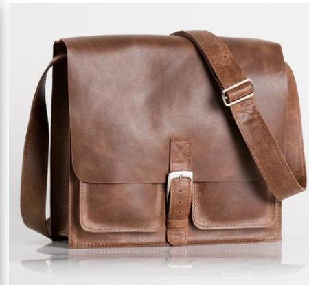
Xhosa small cocoa