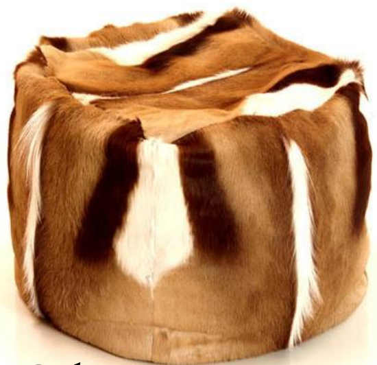
Cube Springbock (ca. 45x45x45cm)