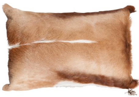
Pure (ca. 40x60cm)