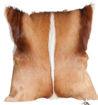
Pure (ca. 30x40cm /40x40cm)