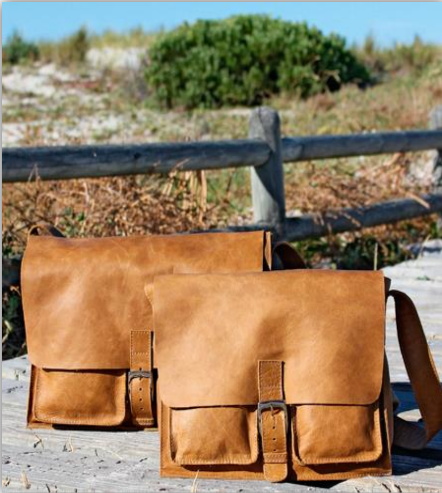
Xhosa small/large natur

Lieferbar in den Farben: D1= natur, D4= cocoa und L1= grey.