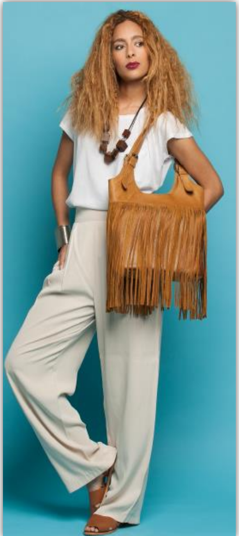
Peek a boo

Die stylische Tasche Peek a boo ist ein Must-Have für das Jahr 2016. Mit dieser Tasche bringen Sie den exotischen Spirit Südafrikas in ihre Umgebung und verzaubern Sie alle mit dem modernen Fringelook.