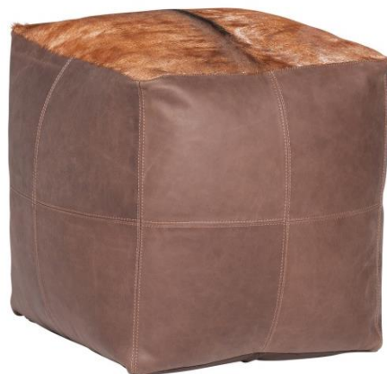
Cube Hartebeestfell cocoa (ca. 45x45x45cm) 131306-S2