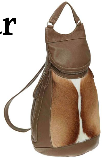
156104-C2 ca. 37x46x23cm