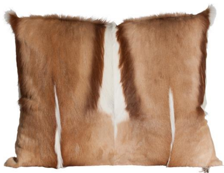
Pure (ca. 60x80cm)